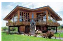
カフェ ハックルベリー