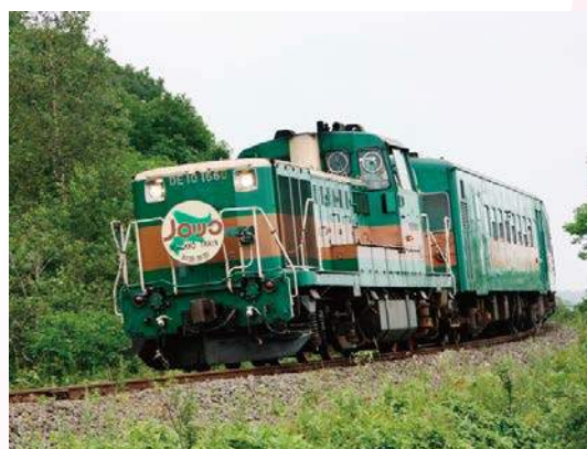
釧路湿原を縦断するように線路が敷設されているので、車では見ることができないロケーションを楽しめます

釧路湿原の中をのんびりと走る観光列車「ノロッコ号」は、4月下旬から10月末までの期間、釧路駅から塘路駅(約40～50分)間を運行。車窓からは湿原の雄大な風景はもちろん、蛇行する釧路川や岩保木水門、運がよければ野生動物を見ることもできます。釧路湿原駅、細岡駅などに停車しながらゆっくりと大自然を縦断。見どころスポットでは列車を減速させることもあり、車内アナウンスによるガイドも行われるので、湿原の魅力を存分に堪能できます。