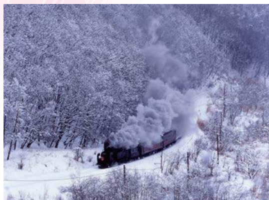
出典元／北海道観光振興機構サイト GoodDay北海道

一面の銀世界を、轟音と蒸気を上げて力強く走行する漆黒の蒸気機関車「SL冬の湿原号」は、2000年から冬季限定の臨時列車として運行されています。その車体は1940年に製造された「C11171」で、1975年の引退後に標茶町の公園で保存されていたものを復元しました。JR釧網本線の釧路駅と標茶駅の間を、片道約1時間半かけて1日1往復します。一部は川湯温泉まで延長運転し、険しい峠道をものともせずに登っていきます。